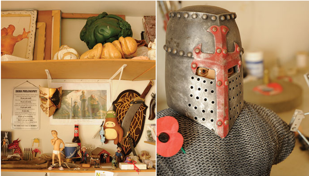
Massinhas, bonecos e criações da infância continuam conservados