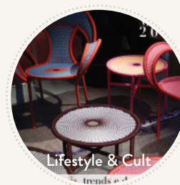
Lifestyle & Cult