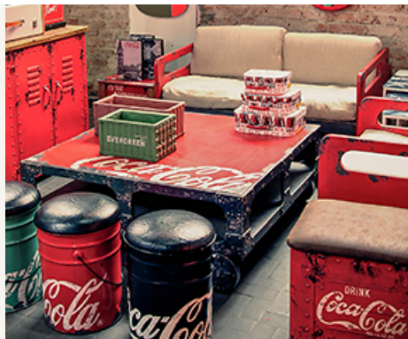
COCA-COLA Itens globais