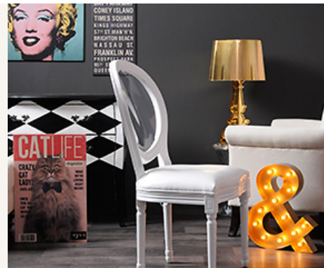
VIVER CONTEMPORÂNEO A regra é não ter regras