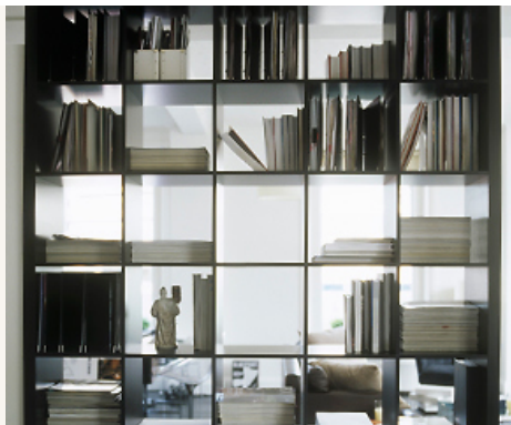
MÓVEIS VERSÁTEIS Otimizando espaços