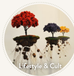
Lifestyle & Cult